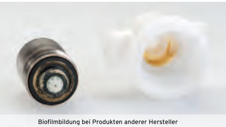
Biofilmbildung bei Produkten anderer Hersteller

In eigenen Wettbewerbsvergleichen stellten wir außerdem hohe Geräuschentwicklungen und Ventil-druckschläge bei den Armaturen anderer Anbieter fest.